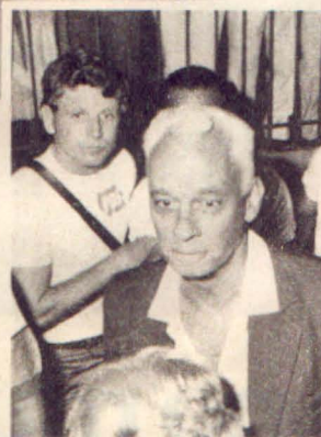
Cruz: carta ao delegado

lícia mineira" na Baixada Fluminense. ARCADA DENTÁRIA — Para o general, foi apenas isso, mas o dossiê deixado por Baumgarten registra outros contatos seus com o comandante Vieira. Em seu documento ao delegado, o chefe da agência central acentua que é o único responsável pelo envolvimento do SNI com Baumgarten e, por isso, é a única pessoa a ser ouvida para esclarecer as dúvidas de Fontenelle. O que o general escreveu na carta já é um avanço: primeiro o SNI admitiu apenas um encon-